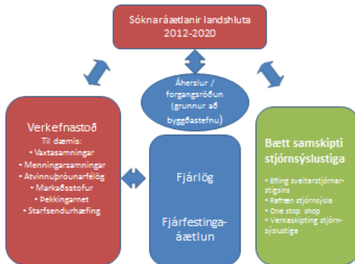
Mynd 3. Grunnstoðir sóknaráætla landshluta